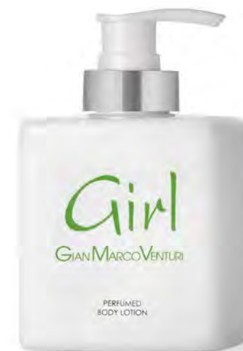
Body Lotion 300 ml