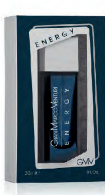
Eau de Toilette Natural Spray 30 ml