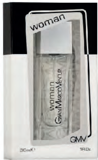
Eau de Toilette Natural Spray 30 ml