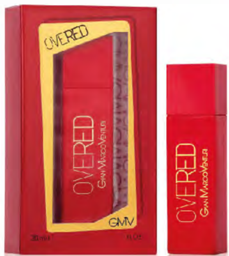
Eau de Toilette Natural Spray 30 ml