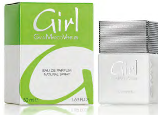
Eau de Parfum Natural Spray 50 ml