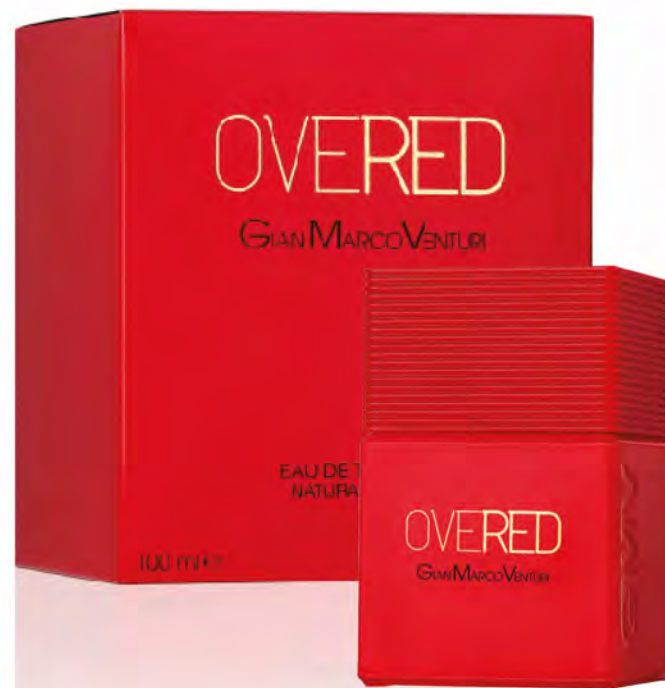
Eau de Toilette Natural Spray 100 ml