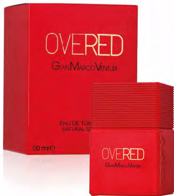
Eau de Toilette Natural Spray 50 ml