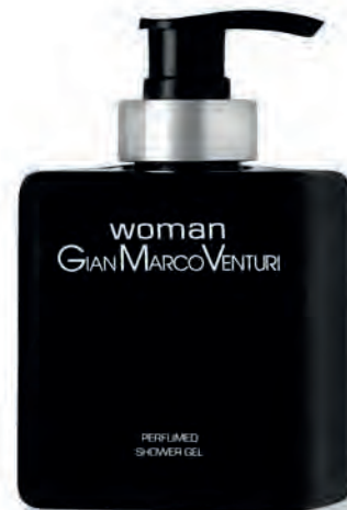
Shower Gel 300 ml