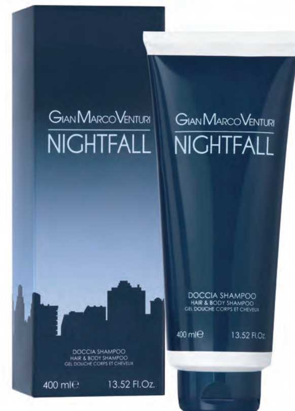
Hair & Body Shampoo 400 ml