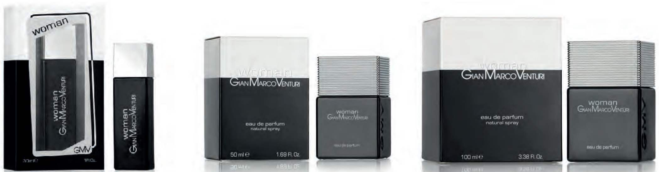
Eau de Parfum Natural Spray 30 ml