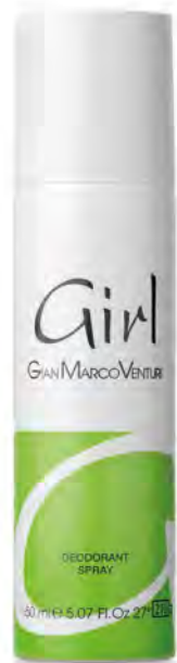
Deodorant Spray 150 ml