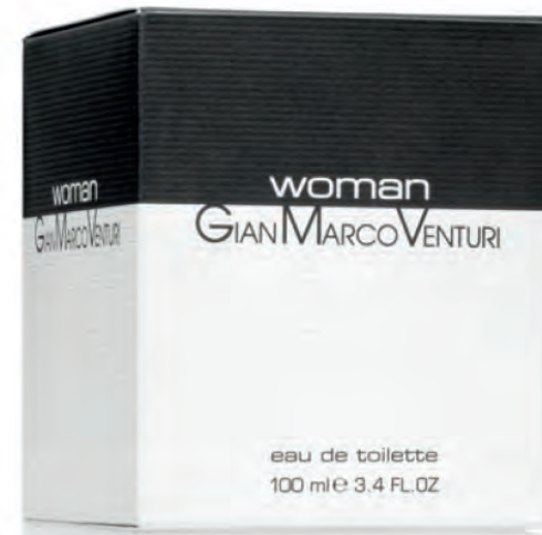
Eau de Toilette Natural Spray 100 ml