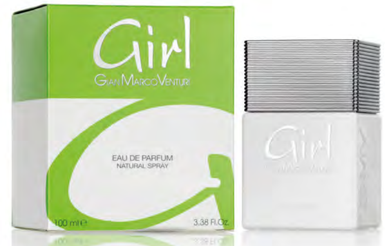
Eau de Parfum Natural Spray 100 ml