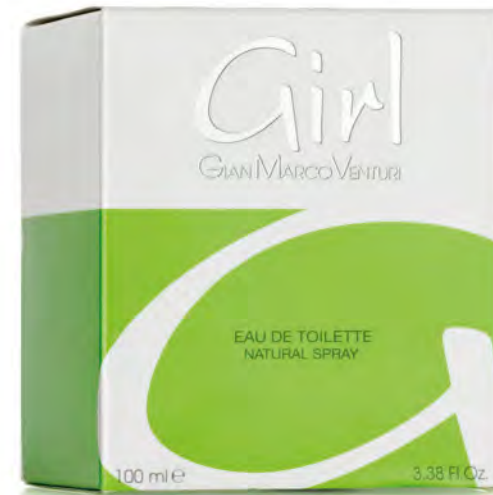
Eau de Toilette Natural Spray 100 ml