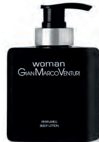
Body Lotion 300 ml