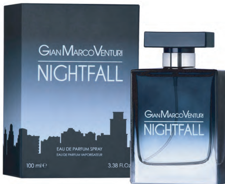
Eau de Parfum Spray 100 ml