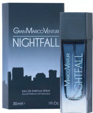
Eau de Parfum Spray 30 ml