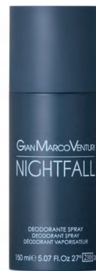
Deodorant Spray 150 ml