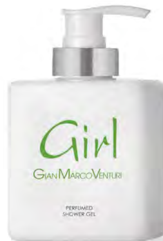
Shower Gel 300 ml