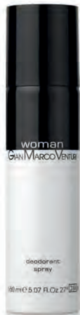
Deodorant Spray 150 ml