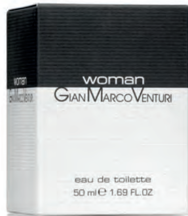
Eau de Toilette Natural Spray 50 ml