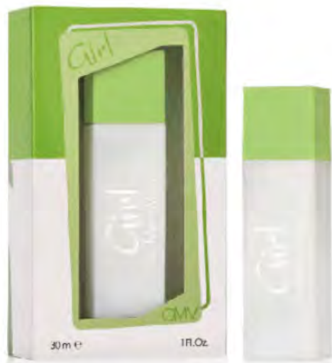
Eau de Parfum Natural Spray 30 ml