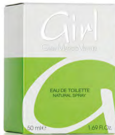
Eau de Toilette Natural Spray 50 ml