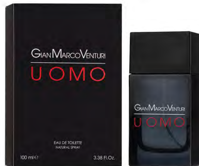
Eau de Toilette Natural Spray 100 ml