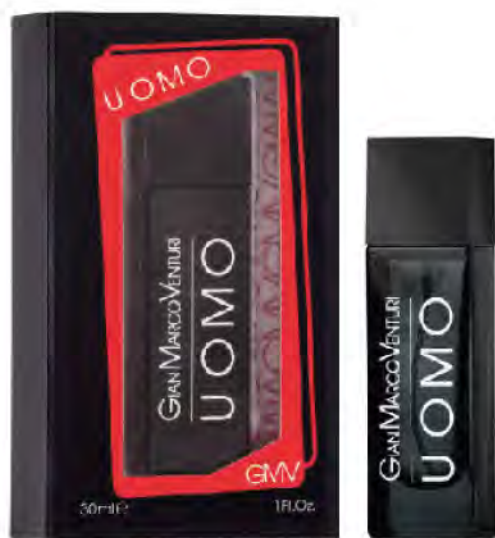
Eau de Toilette Natural Spray 30 ml