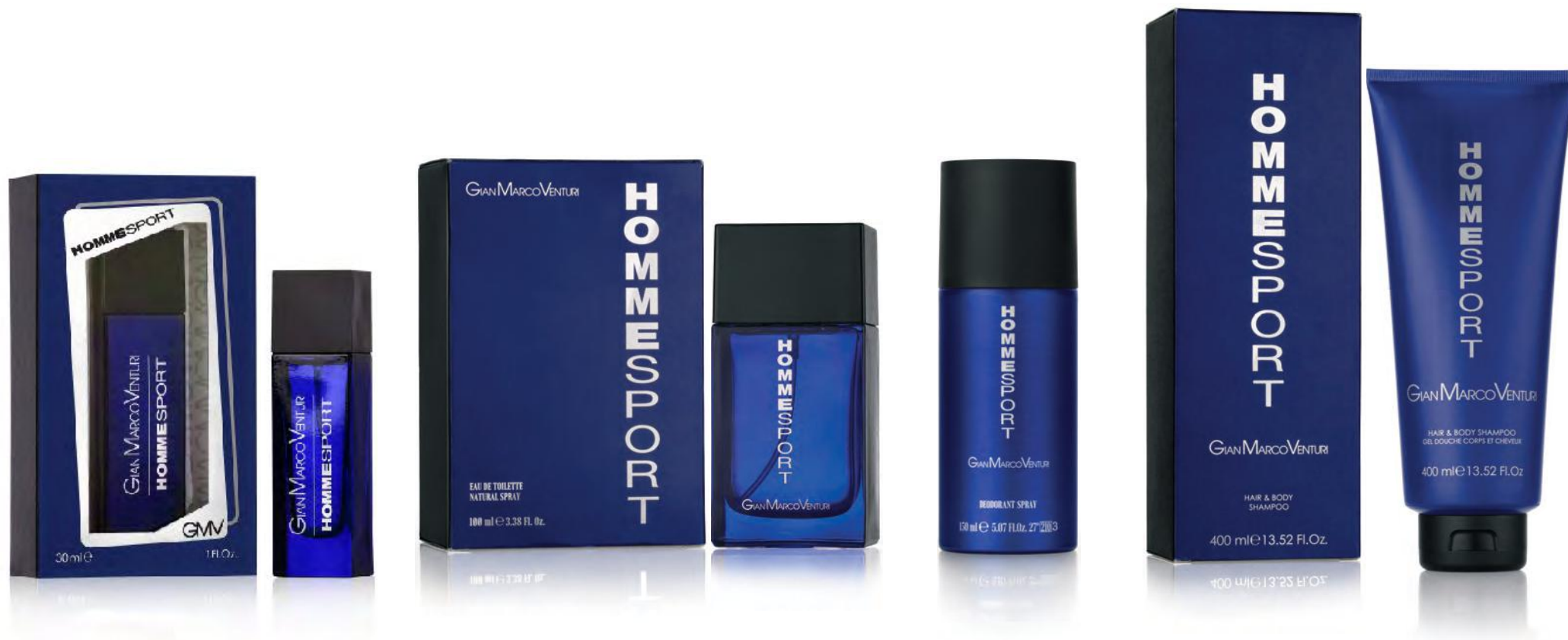
Eau de Toilette Natural Spray 30 ml