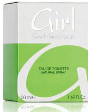
Eau de Toilette Natural Spray 50 ml