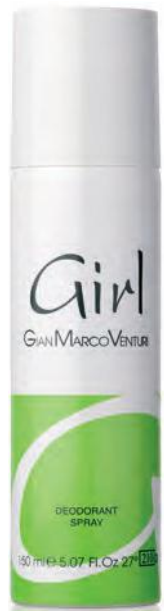
Deodorant Spray 150 ml