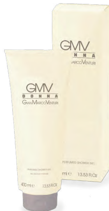
Shower Gel 400 ml