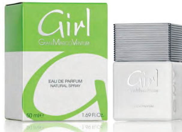
Eau de Parfum Natural Spray 50 ml