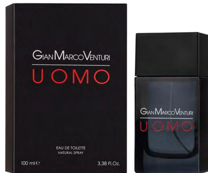
Eau de Toilette Natural Spray 100 ml