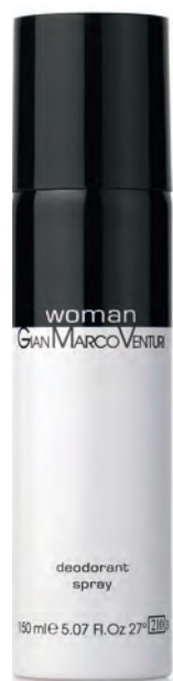
Deodorant Spray 150 ml