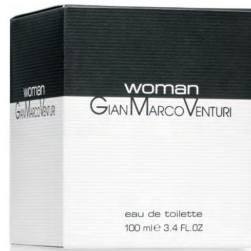
Eau de Toilette Natural Spray 100 ml