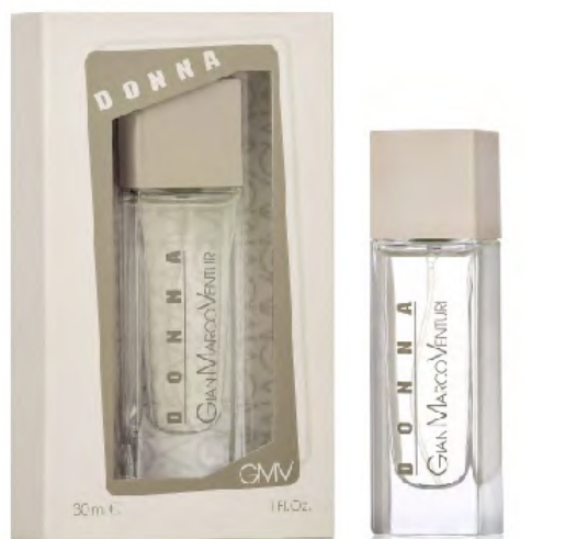
Eau de Toilette Natural Spray 30 ml