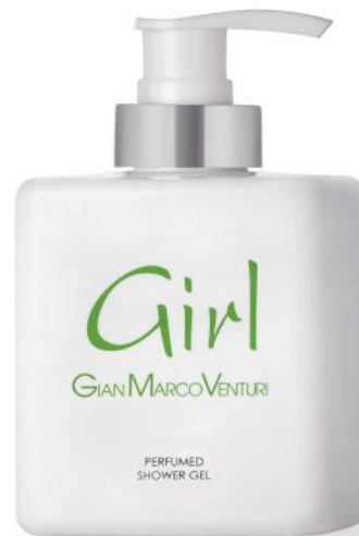
Shower Gel 300 ml