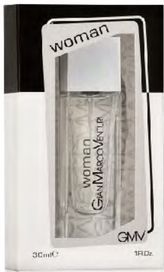
Eau de Toilette Natural Spray 30 ml