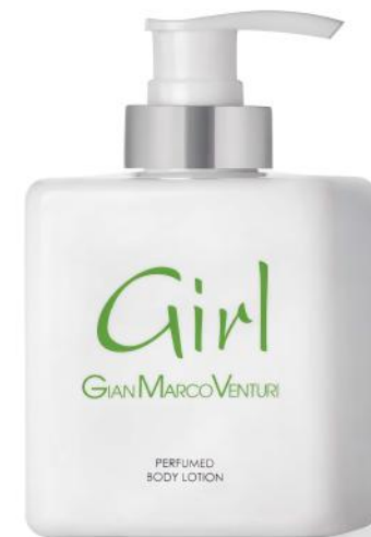
Body Lotion 300 ml