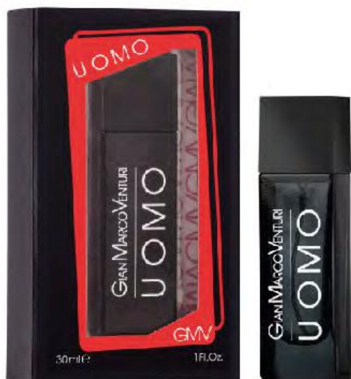
Eau de Toilette Natural Spray 30 ml