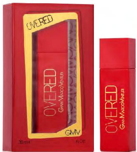
Eau de Toilette Natural Spray 30 ml