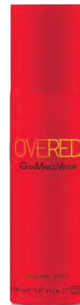
Deodorant Spray 150 ml