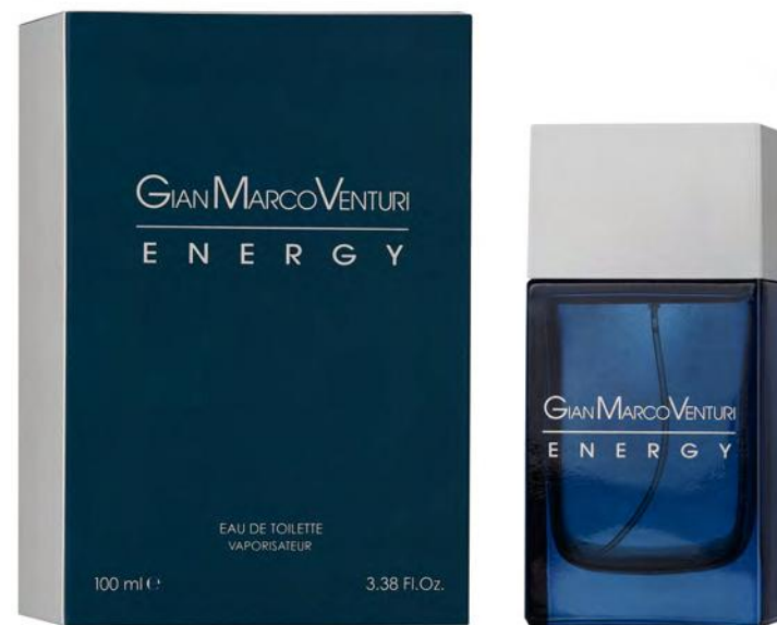
Eau de Toilette Natural Spray 100 ml