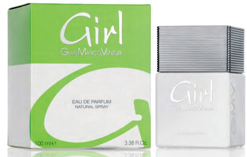
Eau de Parfum Natural Spray 100 ml