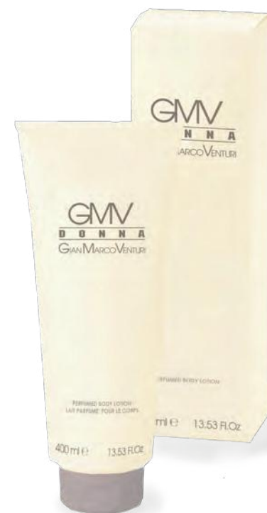
Body Lotion 400 ml