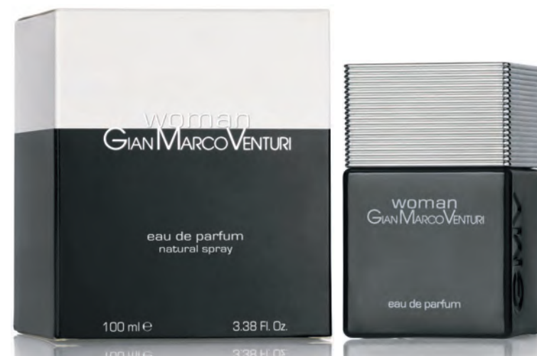
Eau de Parfum Natural Spray 100 ml