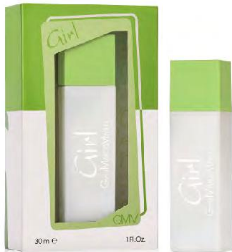
Eau de Parfum Natural Spray 30 ml