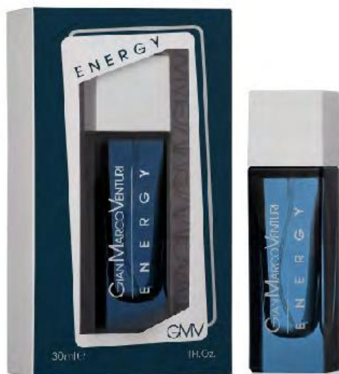
Eau de Toilette Natural Spray 30 ml