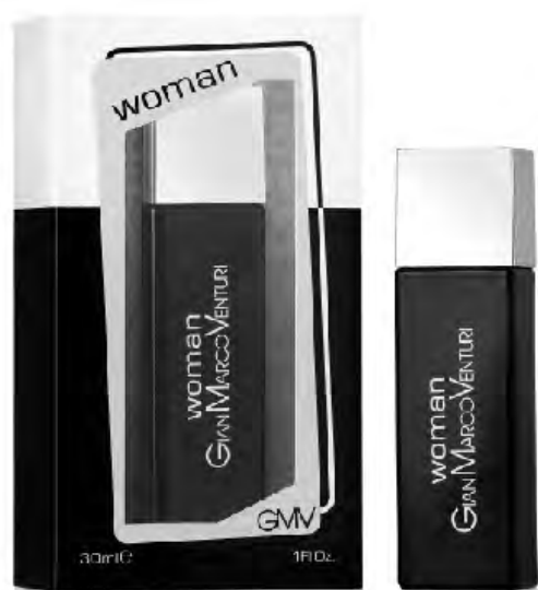
Eau de Parfum Natural Spray 30 ml