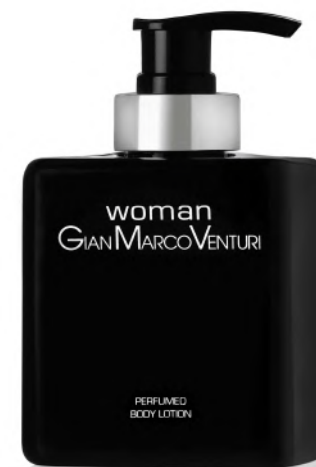
Body Lotion 300 ml