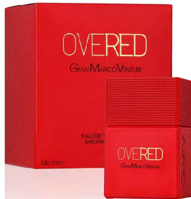
Eau de Toilette Natural Spray 100 ml