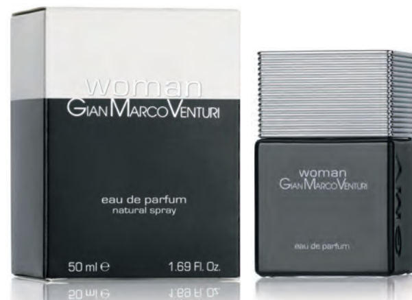
Eau de Parfum Natural Spray 50 ml