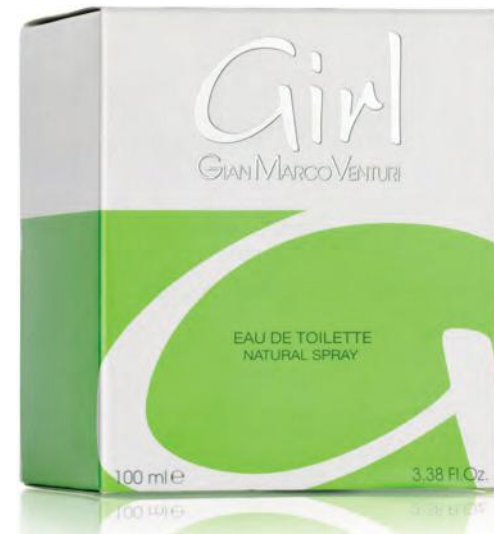
Eau de Toilette Natural Spray 100 ml