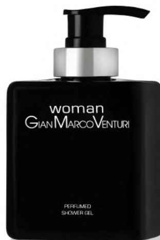
Shower Gel 300 ml