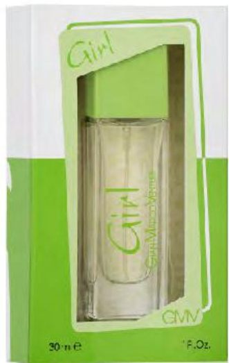
Eau de Toilette Natural Spray 30 ml