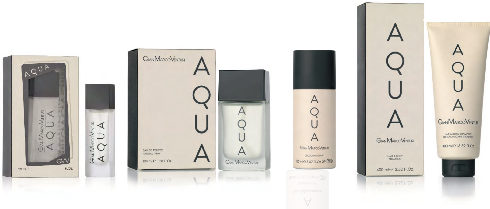
Eau de Toilette Natural Spray 30 ml