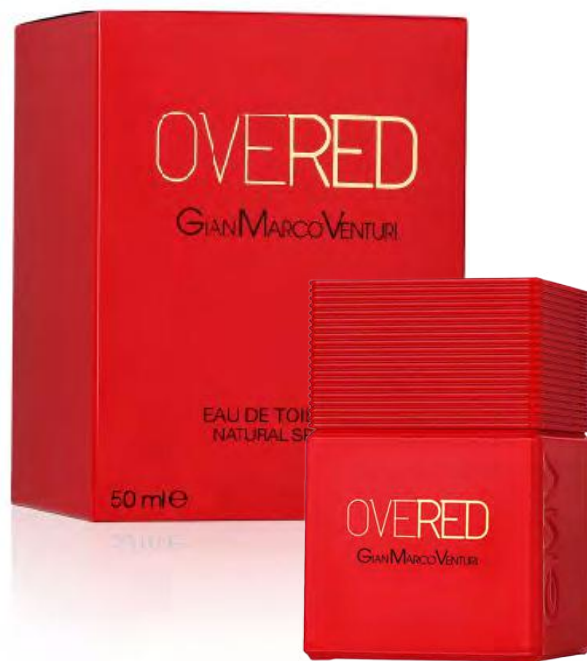
Eau de Toilette Natural Spray 50 ml